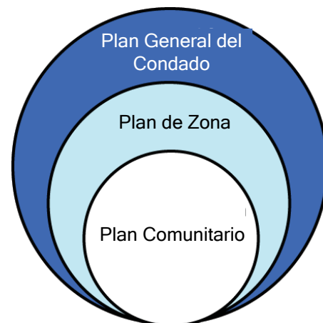
Relación del Plan General con los Planes de Zona y los Planes Comunitarios

A través del Plan de Zona, se identificarán estrategias adicionales de implementación según sea necesario, tales como planes comunitarios, planes específicos y reglamentos de zonificación específicos de la comunidad. En el desarrollo de estos planes, la atención se dirigirá a las áreas de oportunidad, como los centros de tránsito, los corredores principales y la preservación o transición de los distritos industriales.